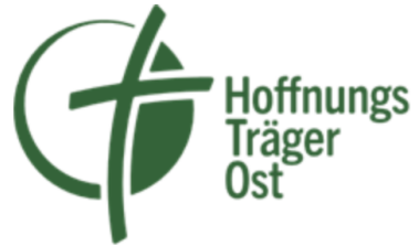
Hoffnungsträger Ost e.V.

Dabei liegt der Fokus insbesondere auf der vom Krieg gebeutelten Ukraine und dem Armenhaus Europas: Moldawien.